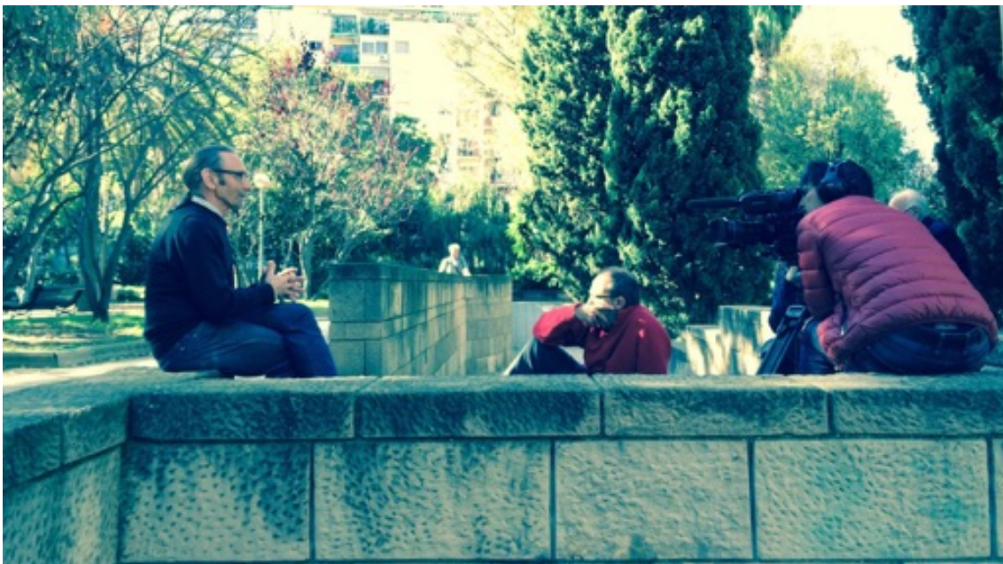
Entrevista a Ferran Soriano.

Candel és un referent social, polític i fins i tot moral indiscutible. Amb els seus llibres, Paco Candel va contribuir decisivament a explicar com era i com es va transformar la Catalunya del segle XX i és, doncs, un personatge fonamental per entendre la nostra història recent. Per tant, i en opinió de molts, Candel ha estat un dels deu catalans més destacats del segle XX.