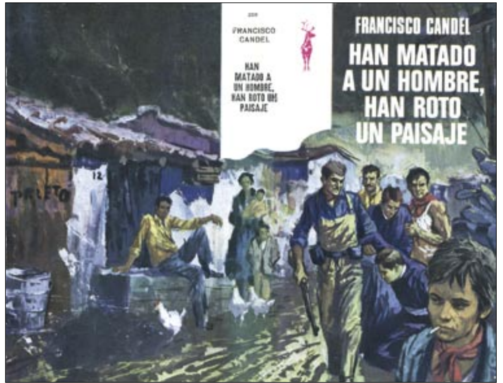
Ediciones GP va publicar als anys 70 moltes obres de Candel a la popular col·lecció Reno, il·lustrades amb impactants cobertes firmades per Gràcia, C. Sanroma i R. Muntanyola i a preus econòmics (50 i 75 pessetes).

També els seus reculls de narracions, com El empleo (Marte ediciones, 1965) o Petit món (Llibres del segle, 1999) i el seu treball periodístic, en part recollit en llibres ( Apuntes para una sociología del barrio , Península, 1972; Crónicas de marginados , Laia 1976...) aporten una visió de les formes de vida als suburbis obrers que van molt més enllà del costumisme. Mig centenar d'obres publicades