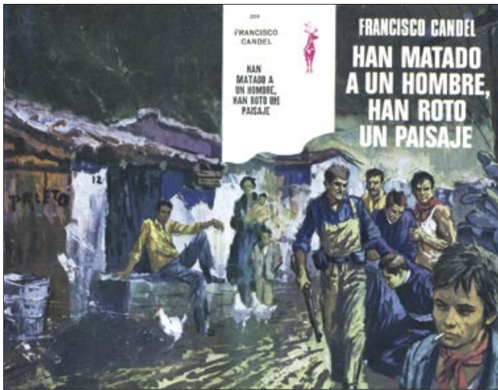
Ediciones GP va publicar als anys 70 moltes obres de Candel a la popular col·lecció Reno, il·lustrades amb impactants cobertes firmades per Gràcia, C. Sanroma i R. Muntanyola i a preus econòmics (50 i 75 pessetes).

També els seus reculls de narracions, com El empleo (Marte ediciones, 1965) o Petit món (Llibres del segle, 1999) i el seu treball periodístic, en part recollit en llibres ( Apuntes para una sociología del barrio , Península, 1972; Crónicas de marginados , Laia 1976...) aporten una visió de les formes de vida als suburbis obrers que van molt més enllà del costumisme. Mig centenar d'obres publicades